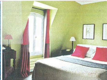
A g.: dormir dans un lit suspendu au Five. Au centre: le charme des chambres mansardées et du bar cosy du Sainte-Beuve. Ci-dessous, L'Empire: derrière sa façade XVIII e , une déco design.