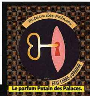
Le parfum Putain des Palaces.

On se démarque en choisissant des eaux pas comme les autres qui affichent notre singularité. On choisit Entrecuisse, Putain des Palaces ou Fat Electrician, chez État Libre d'Orange, et on teste l'effet que ça fait sur les gens en le disant bien haut dans un dîner. Ou alors on s'empare de Sustain, le nouveau parfum d'A.P.C. qui n'en est pas un, qui refuse même l'idée