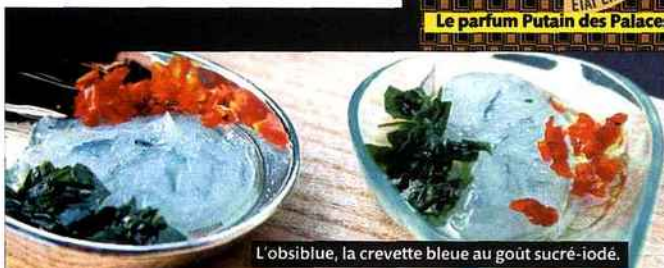
L'obsibluie, la crevette bleue au goût sucré-iodé.

Rien n'est trop rare ni trop pur ni trop respectueux de la nature pour nous. On adhère à l'obsibluie, la crevette bleue au goût sucré-iodé, une espèce unique au monde élevée par une vingtaine de petits producteurs écologiques dans un lagon de Nouvelle-Calédonie. De la seafood de luxe, déjà plébiscitée par les chefs comme Gagnaire ou Ledeuil, en vente au prix de l'obsidienne (75 € le kilo, rens. sur www.obsibluie.com ). On craque pour le bœuf wagyu, alias le bœuf de Kobé, célèbre pour les soins qu'il reçoit : on le masse, on lui fait boire de la bière et écouter de la musique classique. Tout ça pour fondre comme du beurre dans notre assiette au restaurant du Park Hyatt, qui le