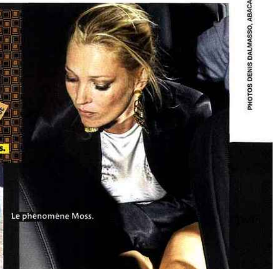
Le phénomène Moss.