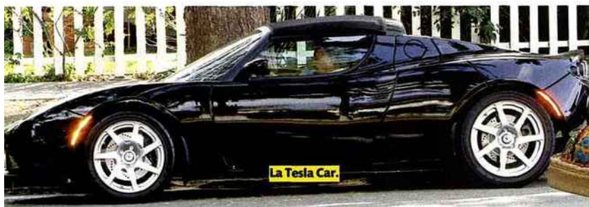
La Tesla Car.