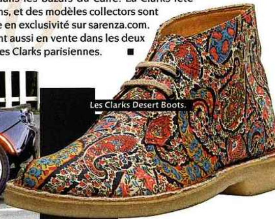
Les Clarks Desert Boots.

Question chaussures, on s'affranchit de la tendance. On oublie les talons hauts, les talons de douze, les talons tout court. On plonge dans le plat. Et on s'offre une paire de Clarks Desert Boots, celle qui a fait le tour du monde et qui avait été inspirée à son créateur par un modèle trouvé dans les bazars du Caire. La Clarks fête ses 60 ans, et des modèles collectors sont en vente en exclusivité sur sarenza.com . Elles sont aussi en vente dans les deux boutiques Clarks parisiennes. ■