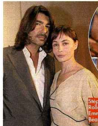
Stéphane Rolland et Emmanuelle Béart