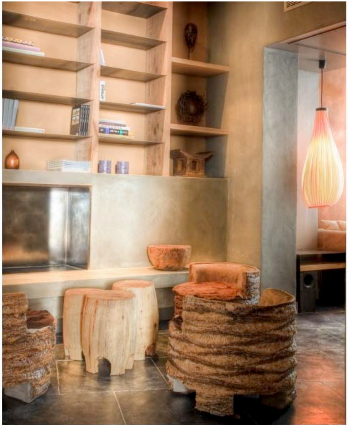
La salle à manger située au sous-sol est privatisable et personnalisable, elle peut accueillir une douzaine d'invités pour les cocktails, réceptions, dîners d'affaires....